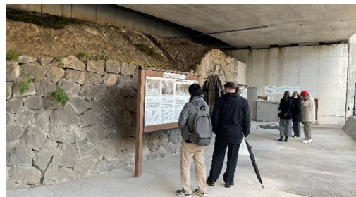
史跡ツアーの様子