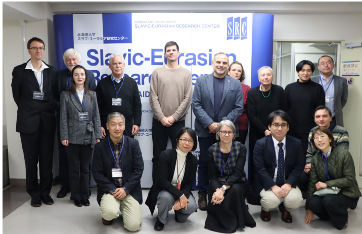
シンポジウム参加者と関係者

言語標準化、民族アイデンティティ、国家性の問題は、とりわけヨーロッパの諸帝国が崩壊に向かい、国民国家の形成に向かう19世紀と関連付けられて論じられますが、実際にはより根が深く、個々の事例もこのよ