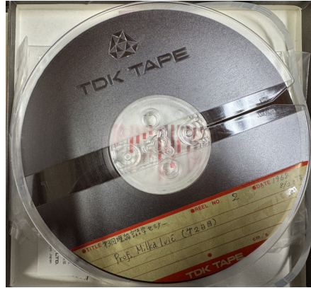
東京言語研究所から貸与された 講義録音のテープ

への言及はなかった。したがって、1972年のイビッチ論文でのペーリッチ論は、あとから付け加えられたものであることが確認された。既に論文集のゲラ作成が進んでいたため、もはや拙稿は訂正のしようもなかったが、思いもよらぬ形で事実が明るみになった。私が的を外してしまったのは否めないが、だからと言って残念な気持ちもあまり生まれえない。今回の研究成果は言語学史に劇的な発見や新展開をもたらしたわけではないものの、可能な限りの力を結集して、また想像し得ない幸運にも恵まれ、偉大な恩人の知られざる足跡を研究史に位置付け、忘却の危機から救い出したことを誇りに思っている。拙稿の学術的評価は、言語学史に取り組む研究者に委ねたいと考える。