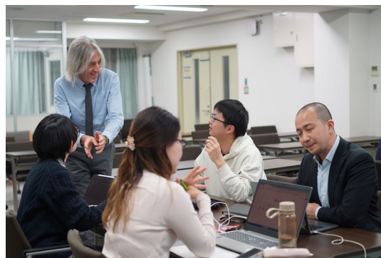
初日のペアワークの様子

講習1日目には、まずOxford大学で用いられている論文執筆の手引きをもとにTroy氏が学術論文の基礎的な構造を解説し、そのうえで実際に査読誌に投稿された要旨をもとに、そこに書かれている研究目的、研究手法、研究意義、社会との関連性を読み解く練習をいただきました。後半はベクトウルスノフ研究員に論