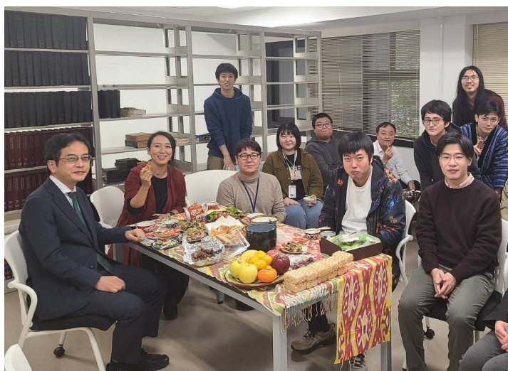
研究者・院生主催の誕生日祝い 中央アジア料理を囲んでの昼食会

に負債を負っている、特権的な教育を受けさせてもらったのだから、それを返すために人民に奉仕しなければいけないという考え方ですね。もちろん人民という何か一つのものがあるということ自体が知識人の想像であって、実際は一般の人々の中にも多様な考え方や利害を持った人たちがいるから、ナロードニキの「人民の中へ」という運動は失敗するんですけど、や