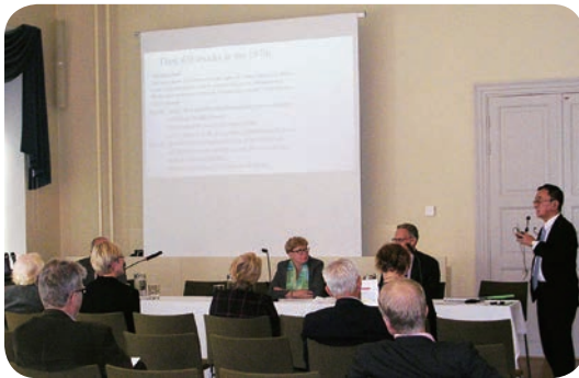
ワークショップの1コマ

会議での報告の大半を占めたのは、19世紀後半くらいからの3カ国の経済発展を比較するものであった。19世紀後半には遅れていた3国（three latecomers or catching-up countries）が、どのようにしてキャッチ・アップしたのか、あるいは、し損なったのか議論された。分析手法も、計量分析から制度や思想の分析まで、様々であった。日本とロシアの比較では、1860年代から1910年代頃までは共通性が多かったにもかかわらず、1960年代、70年代に大きく差がついた原因が議論され、日本とフィンランドの比較では、90年代以降、日本が足踏みし、フィンランドが先を進むようになった原因も議論された。