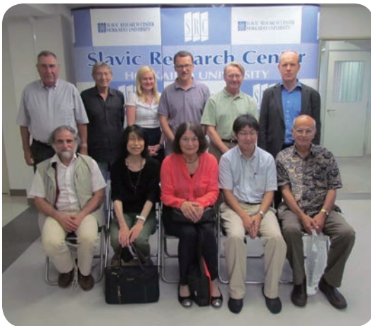
ワークショップを終えて

本ワークショップの組織にあたり、日本スラヴ学研究会、日本ロシア文学会および同北海道支部から有形無形の支援を受けました。紙面をお借りして、関係者の皆様にお礼申し上げます。プログラムは以下の通りです。[野町]