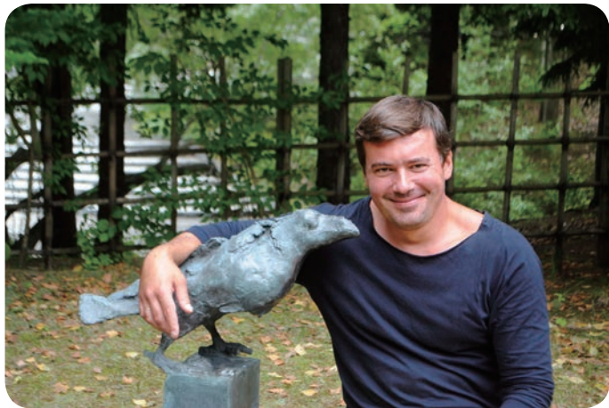
札幌芸術の森でカラスのブロンズ像と

私と妻が日本へ行く準備をしていた時、こんな注意を受けた。「気を付けてください、向こうでは足りないものが山ほどあると思いますよ！」その「山ほど」という言葉から黒パン、塩漬けの脂身、ボルシチ、ジャガイモを添えた塩漬けニンジンなど東欧料理の選り抜きの品々に思い当たった。それで私たちは黒パン、塩漬けの脂身、ピーツその他を持ち込んだ。新千歳空港の税関職員が丁寧に洗ったピーツで作ったボルシチは私たちの食生活の孤独感を和らげてくれた。ピーツはくっついていたモスクワ郊外の土くれを残らず落とすために洗われたのだ。私たちが最初に驚いたのはこの時だった。