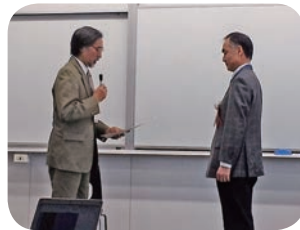
コンソーシアム宮崎会長から表彰を受ける筆者

2008～2012年度新学術領域研究「ユーラシア地域大国の比較研究」（領域代表者 田畑伸一郎）は、第3回（2013年度）地域研究コンソーシアム研究企画賞を受賞しました。地域研究コンソーシアムは、世界諸地域の研究に関わる研究組織、教育組織、学会などをつないで、情報交換や研究活動を進めるネットワーク組織で、スラブ研究センターもその活動に積極的に参加しています ( http://www.jcas.jp/ )。審査委員会の講評のなかでは、「現代において経済的なプレゼンスを高めるロシア、中