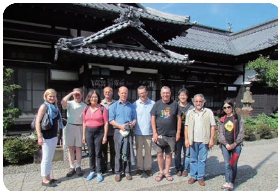
国際ワークショップ「ヨーロッパ言語地図の中の スラヴ諸語」の後のエクスカーシヨンの様子 （にしん御殿）