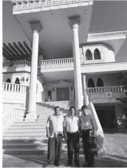
ベネズエラ・カラカスでブティック経営