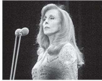
歌手 フェイルーズ