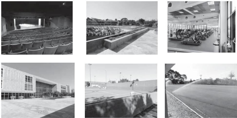
図 12 「レバノン山地クラブ」 サンパウロ中心部 2010 年撮影

人の 3 人がてっぺんにいて、お互いに仲良くしているという構図です【図 11】。