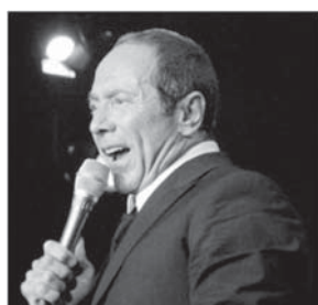
Paul Anka , 歌手、カナダで2世