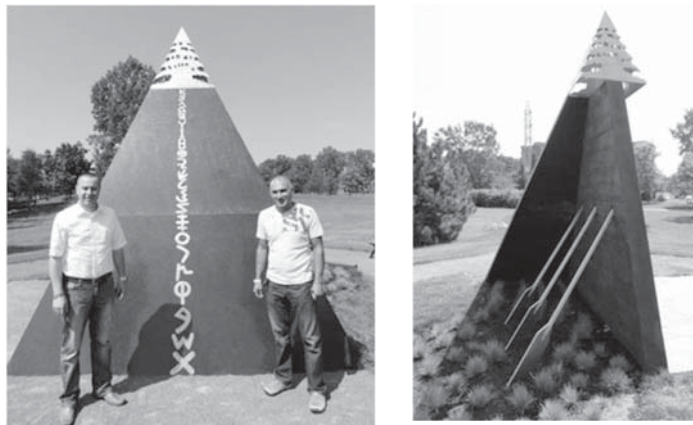
図 5 カナダ・モントリオールのレバノン移民記念碑 フェニキア文字、フェニキア人の船のオール、レバノン杉

このように、移民が動いて、そこに定着して子孫を作っていくと、その経験や記憶が時間の経過とともにいろいろな層を成してきます。つまり、移民が獲得する空間そのものが多層性を帯びていること、さまざまなレイヤーを移民に応じてこちらも観察し、研究対象としなければいけないことから、研究者は常に多正面作戦を強いられます。第一次世界大戦における戦闘の前方、後方の問題でもありませんが、とにかく考えだすと厄介なことばかりが出てくるわけです。