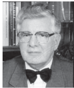
Julio Cesar Turbay Ayala , 元コロンビア大統領、2 世