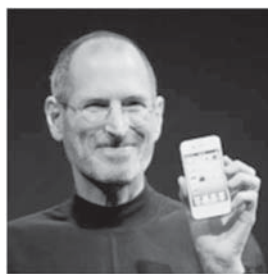
Steve Jobs, アップル創業者 アメリカで 2 世