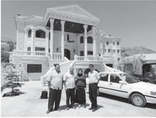
レバノン・ベカー高原南部の帰還移民（1980年代に移民、2000年代に帰還）カナダ・カルガリーでレバノンレストラン経営