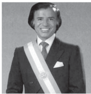
Carlos Menem , 元アルゼンチン大統領、2 世