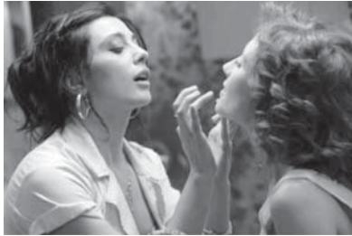
映画監督・女優 ナディーン・ラバキ

男ばかりではいけませんので女性もということで【図 4】、右下はバヒーヤ・ハリリーさんという政治家でして、前の左下のハリリーさん これは前首相で、2005年に爆弾で暗殺されたお父さんも首相を務めた人です の叔母さんに当たる方です。