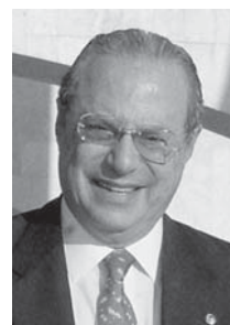
Paulo Maluf , 元サンパウロ市長、元サンパウロ州知事、ブラジルで 2 世