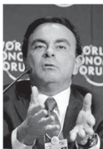
Carlos Ghosn, 日産 CEO ブラジルで 3 世

クタイムズも所有し、いろいろ複合的にやっておられます。右の方、スティーヴ・ジョブズさんも皆さんご存じと思いますが、この方は生みの父がシリア人で、シリア系 2 世といえます。