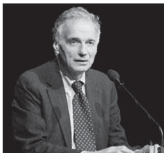
Ralph Nader , 市民運動家、大統領候補、アメリカで 2 世

政界の続きですが【図 7】、左上の人がラルフ・ネーダー、アラビア語でいうと「ナーデル」ですが、アメリカの万年大統領候補で、いつも民主党の票を食うと嫌がられている人です。上段真ん中が、かつてアルゼンチンの大統領をしていたカルロス・メネム、右は元コロンビア大統領のトゥルバイ。それから左下の写真ですが、右側の方は皆さんよくご存じの、故エドワード・ケネディ上院議員ですが、その奥さんがレバノン系 2 世です。奥さんだから何だとおっしゃるかもしれませんが、アメリカではケネディ家に入るといのは大変なステータスなのです。