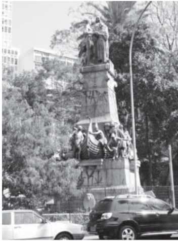
図 11 1922 年「独立百周年記念シリア・レバノン人委員会」による「シリア・レバノン人の友情」像、1928 年除幕。上部：ブラジルの栄光の女性、純粋なシリアの乙女、ブラジルの兄たる先住民戦士。中段：フェニキア人の舟

ウリブ」という言葉からきていますが、と呼ばれるアラブ・クリスチャンが、ウマイヤ朝の時代からずっとイベリア半島に長く暮らしていて、もちろんレコンキスタで駆逐されたり改宗を強制されたりと、いろいろな問題がありますが、しかし、数世紀にわたって共存してきた記憶があって、このことからポルトガル人やスペイン人らイベリア半島の人々の中にはアラブ人と共通の性格があるという話だったのです。イベリア半島の人々の人種をどうとらえるか、という議論の中でこれが出てきたのです。