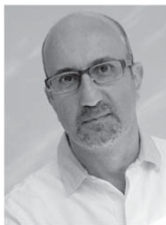
Raymond Khoury , ミステリー作家、イギリスで1世