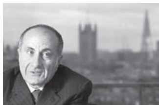
Jacques Nasser, Ford Europe CEO 等。オーストラリア等で 1 世