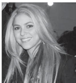
Shakira , ポップス歌手 コロンビアで2世