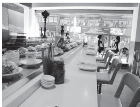
図1 ロンドン・ナイツブリッジのハロッズフードコート内の回転レバノン料理 2009年

最初の写真【図1】ですが、これはロンドンのナイツブリッジにハロッズという有名なデパートがありますが、そのフードコートの中の「回転レバノン料理屋」というべきものです。回転寿司のようにレバノン料理が回ってくるのですが、皿の色ごとに値段が設定されていたり、ガリの代わりにオリーブが置いてあったりという、そういうところも食文化がグローバル化している1つの表れかと思