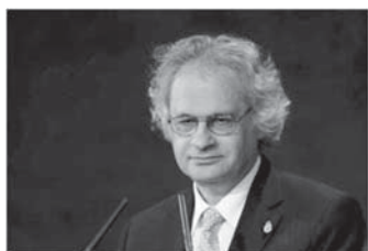
Amin Maalouf , 作家、ゴンクール賞受賞者。仏学士院会員、フランスで1世/3世

左下はシャキーラというポップスでは世界的に有名な歌手です。それからポール・アンカ、皆さんご存知の『マイウェイ』の歌手ですね。右下は世界的な心臓外科医だった故マイケル・ドゥベイキー、「神の手」といわれるような人物でした。