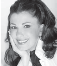
歌手 マージダ・ルーミー