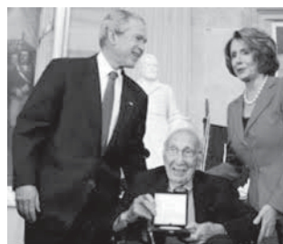
Michael DeBakey (Dabaghi) , 心臓外科医、アメリカで2世