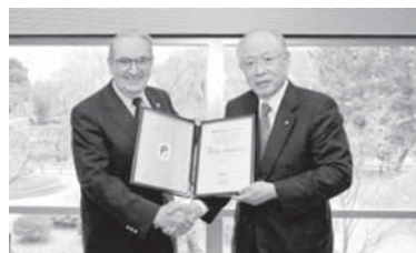
Elias Corey , 有機化学者、ノーベル賞受賞者。理研名誉フェロー、アメリカで3世