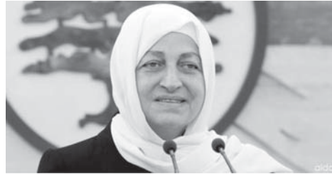
国会議員 バヒーヤ・ハリリー