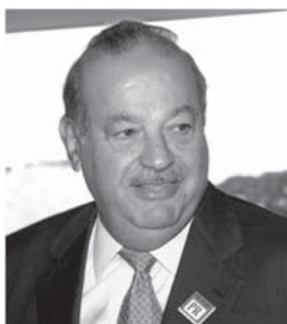
Carlos Slim, 富豪世界一 メキシコで 2 世