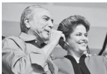
Michel Temer , ブラジル副大統領、3 世?