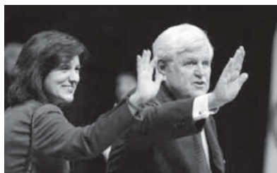
Victoria (Oreigi) Kennedy, Edward Kennedy 上院議員夫人、アメリカで 2 世