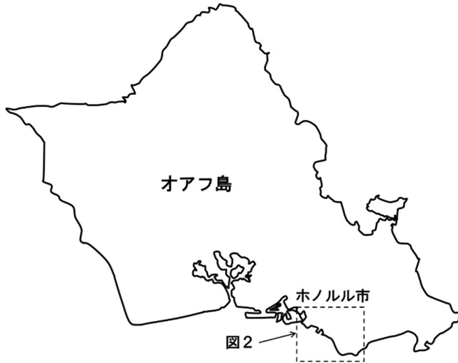
図1 オアフ島 (13)

的な新型コロナウイルスの感染拡大に伴う変化の影響は、ハワイのサーフゾーンやビーチにも及んだ。そしてそれは、ハワイの海と陸の地理的な境界域に現れていた事象を、一時的に変化させた。本稿執筆時において新型コロナウイルスの流行は続いているが、分かり得る範囲においてその変化についても論じる。