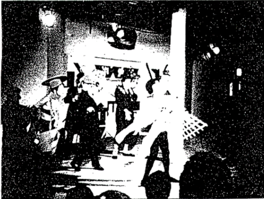
1983 reconstruction of Good Treatment for Horses.