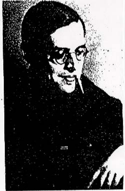
H. M. Фоперреп