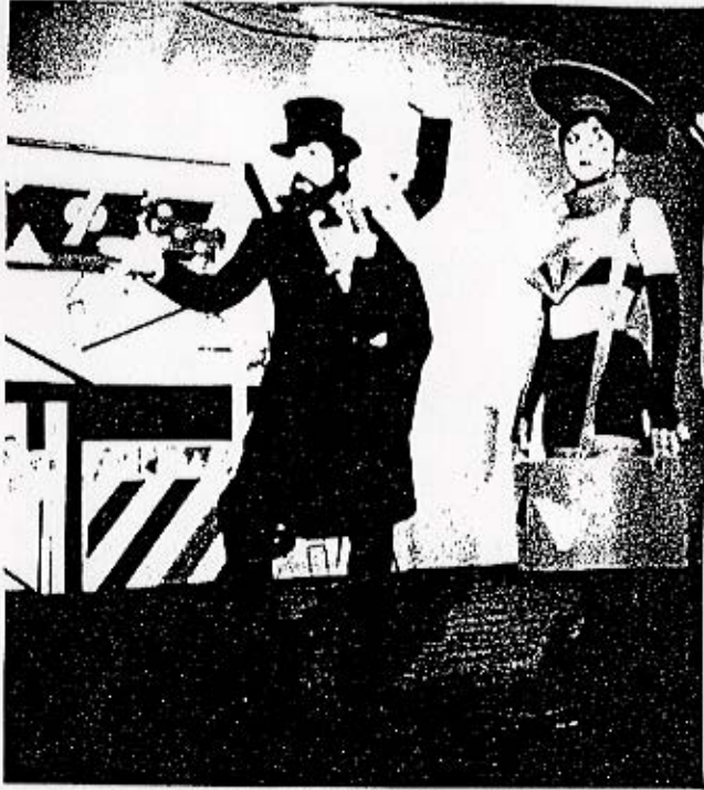
1983 reconstruction of Good Treatment for Horses.