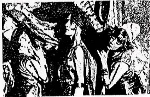
Detail from Mastfor's earliest work.