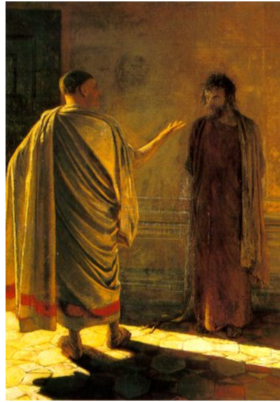
13 ゲー 《真実とは何か？キリストとピラト》(1890) 233×171 モスクワ、トレチャコフ美術館