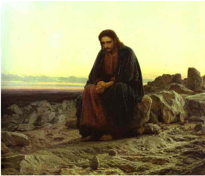
16 クラムスコイ《荒野のキリスト》(1872) 油彩 カンヴァス 180×210 モスクワ、トレチャコフ美術館