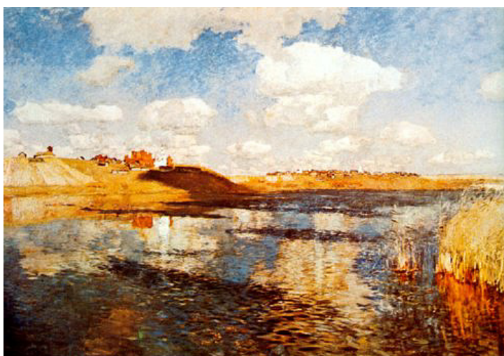
19 レヴィタン《湖。ルーシ》(1899-1900) 149×206 ペテルブルグ、ロシア美術館