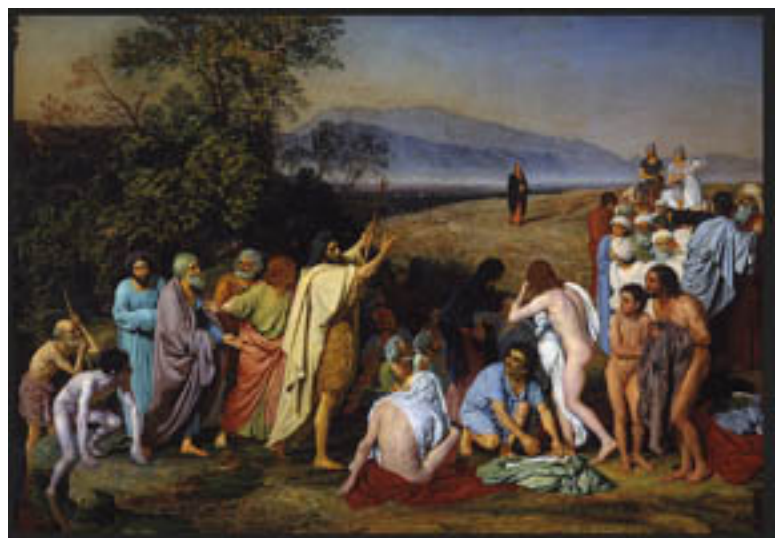
15 A.A.イワーノフ 《民衆の前に現れたキリスト》(1837-1857) 油彩、カンヴァス 540×750 モスクワ、トレチャコフ美術館