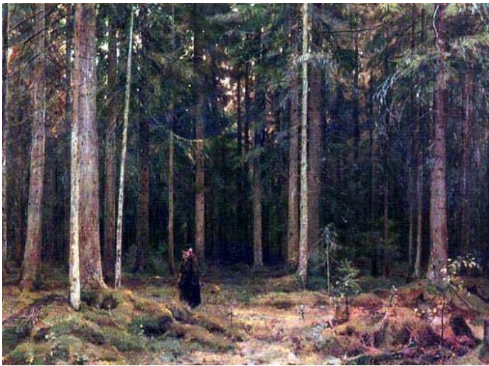
23 シシュキン 《モルドヴィノヴァ伯爵夫人の森で。ペテルゴフ》 81×108 モスクワ、トレチャコフ美術館