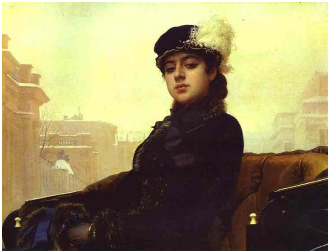
17 クラムスコイ《見知らぬ女》(1883) 油彩 カンヴァス 75.5×99 モスクワ、トレチャコフ美術館