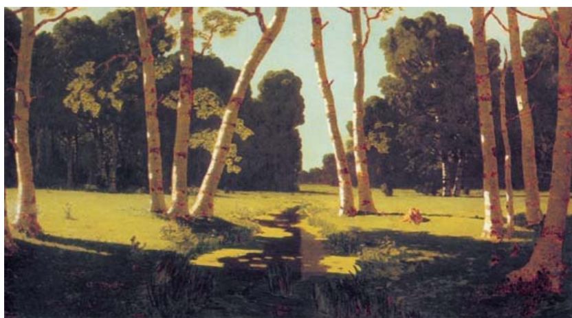
20 クインジ《白樺林》(1879) 油彩、カンヴァス 97×181 モスクワ、トレチャコフ美術館