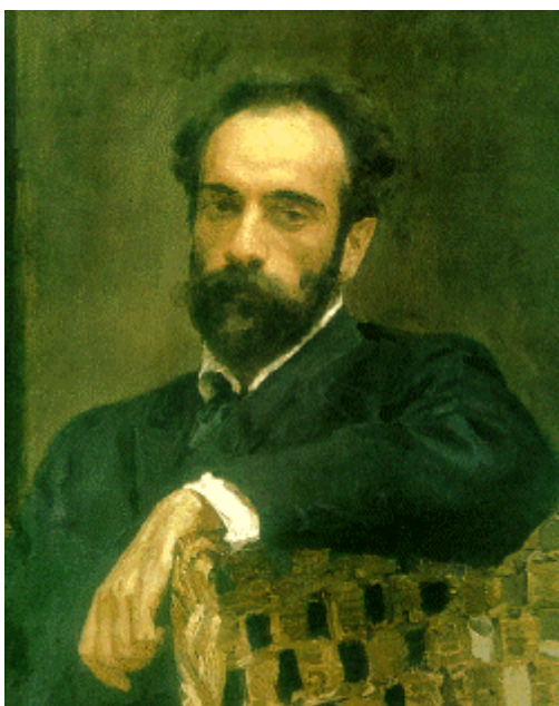
18 セローフ《レヴィタン》(1893) 油彩、カンヴァス 81.5×86 モスクワ、トレチャコフ美術館