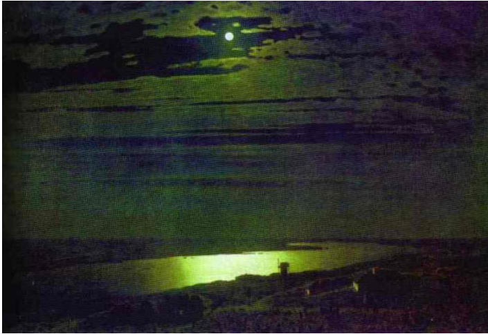
22 クインジ 《ドニエプルの月夜》(1880) 油彩、カンヴァス 105×144 モスクワ、トレチャコフ美術館