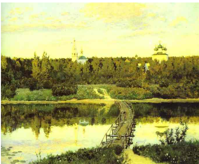
24 レヴィタン 《静かな修道院》(1890) 油彩、カンヴァス 87.5×108 モスクワ、トレチャコフ美術館