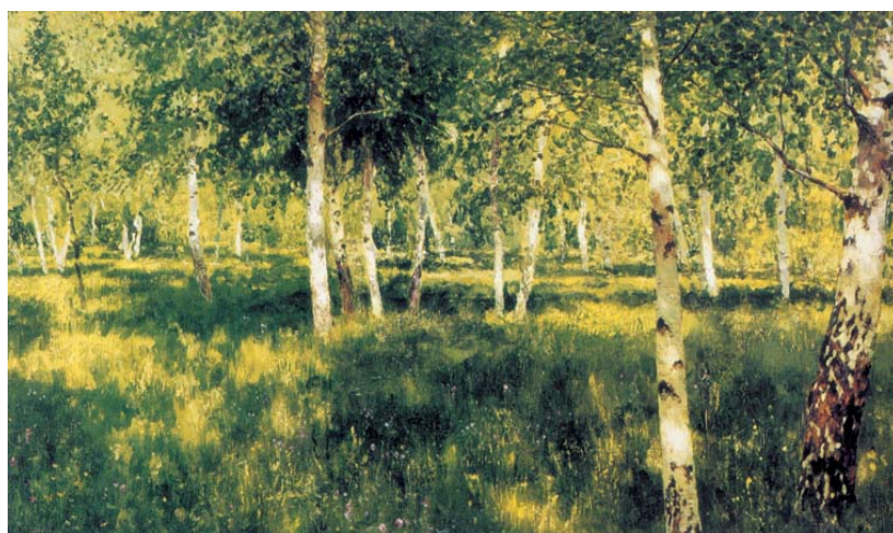
21 レヴィタン《白樺林》(1885-1889) 油彩、カンヴァスに貼った紙 28.5×50 モスクワ、トレチャコフ美術館